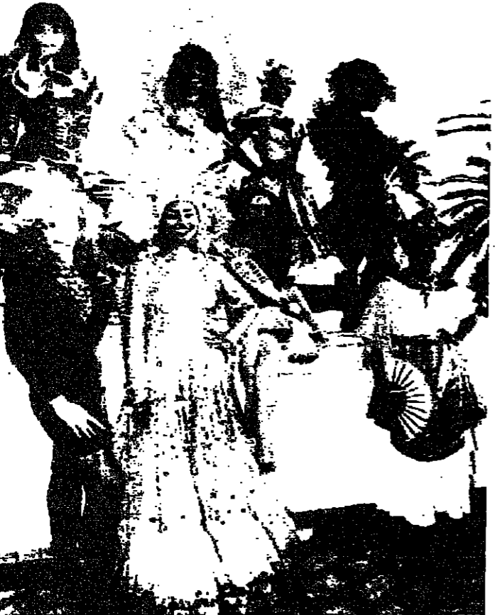
ملكات الكرنفال في البرازيل، والارجنتين، وإيطاليا، واليونان، والجزر الهندية الغربية، والمارتنيك، لدى وصولهن أمس الأول إلى مدينة نيس حيث وقفن مع ملكة نيس لاتخاذ الصور التذكارية. وستشارك باقة الجمال هذه في مبراة انتخاب ملكة الملكات، التي ستجري خلال إقامة كرنفال نيس.